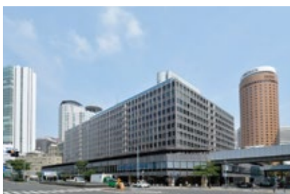
クリニックがある大阪第1ビルと周辺の風景

透析患者さんの快適な生活と社会復帰を支援する医療をめざし、グループ病院をはじめ地域の病院とも連携を図りながら、きめ細かな対応ができるよう体制を整えております。